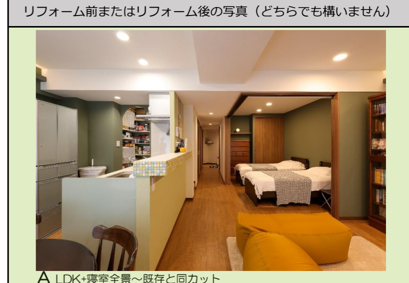
A LDK+寝室全景～既存と同カット