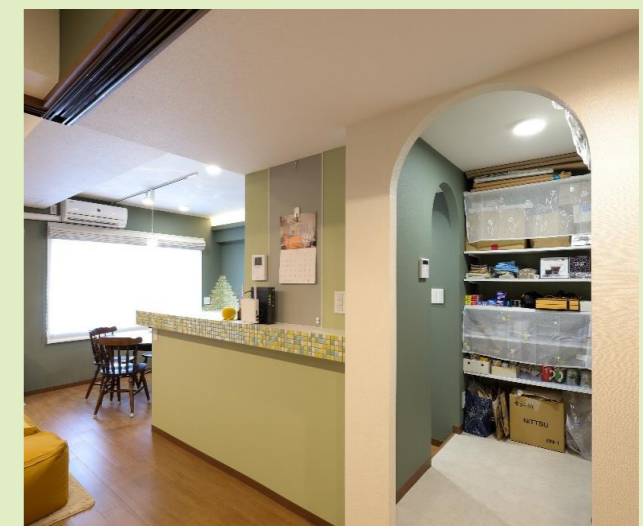
D LDK～パントリーは回遊動線に