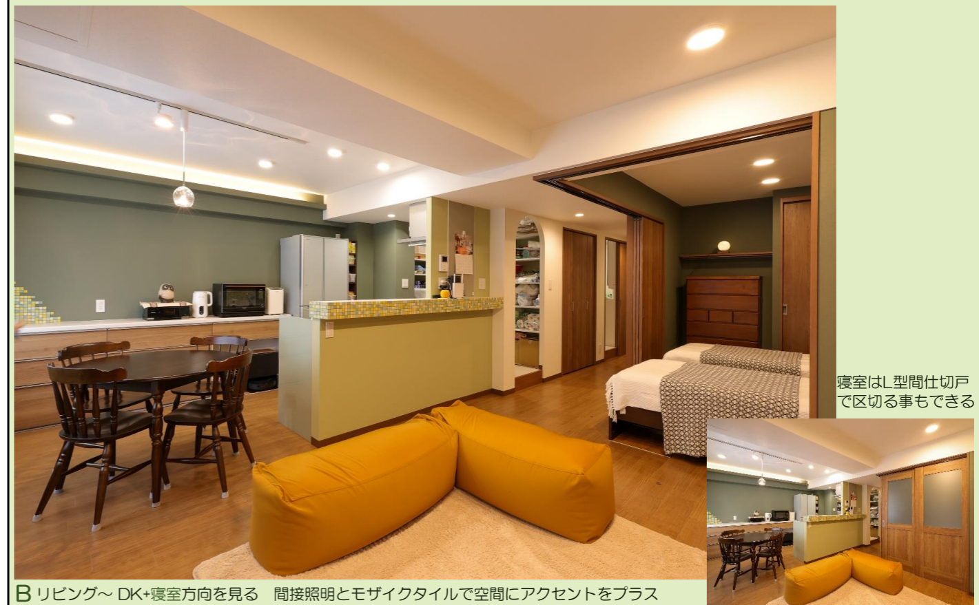
B リビング～DK+寝室方向を見る 間接照明とモザイクタイルで空間にアクセントをプラス