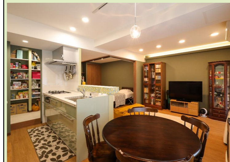
C DK～リビング・寝室方向