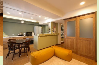
寝室はL型間仕切り戸で区切る事もできる